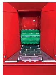
Rouleau + tapis ameneur