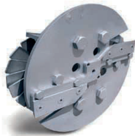
Couteaux acier trempé