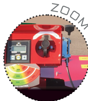
Panneau de commande