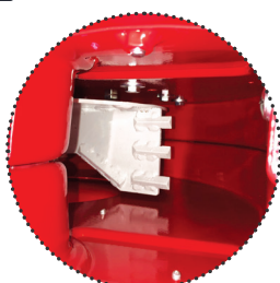
Pales de ventilation / Avec système de broyage