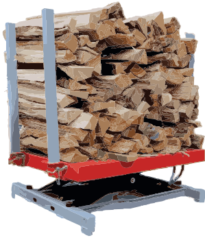
..... ● ELEVATEUR HYDRAULIQUE